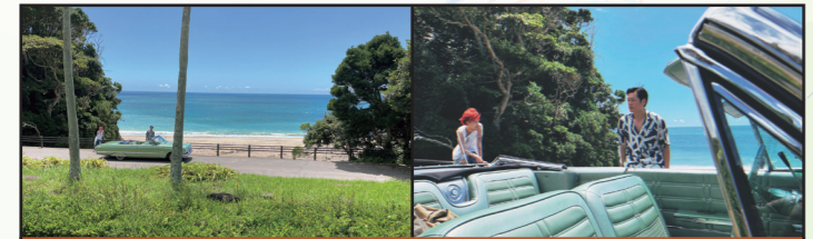
撮影中スタッフを癒したみたすの湯

何かから少しだけ逃げたかった。幼馴染の雨屋草太(井浦新)と星野楽人(成田凌)は都市伝説の“火の鳥”を探そうと、自由気ままに旅に出かける。旅の途中でキャラの濃い面々に出会いながら、次第に、草太と楽人の隠しごとが明らかになっていく。2人の旅の理由は一体何なのか? なぜ、“火の鳥”なのか? サプライズなラストが壮大な旅を物語る。