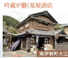
吟蔵が働く泉屋酒店 南伊勢町大江