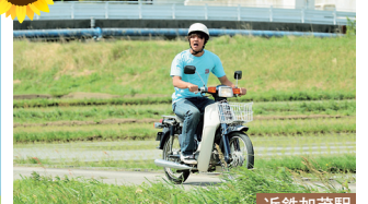
近鉄加茂駅 吟蔵がバイクで理緒を追いかける。