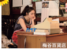
梅谷百貨店 万里香が営むお店。