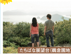
たちはな展望台(鶴倉園地)