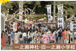
一之瀬神社・旧一之瀬小学校 公民館や上湖祭のメイン会場。