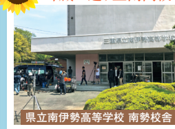
県立南伊勢高等学校 南勢校舎