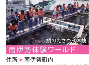
南伊勢体験ワールド 住所 ▶ 南伊勢町内 TEL ▶ 0599-66-1717(南伊勢町観光協会) 海で!山で!楽しい体験が盛りだくさん!! 詳しくはHP: http://www.g-t-w.jp