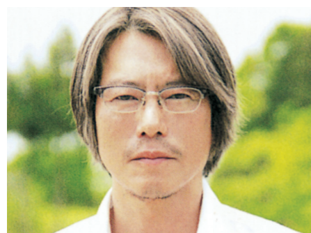
海江田醇 [豊川悦司] 角島大学哲学科の教授 52歳