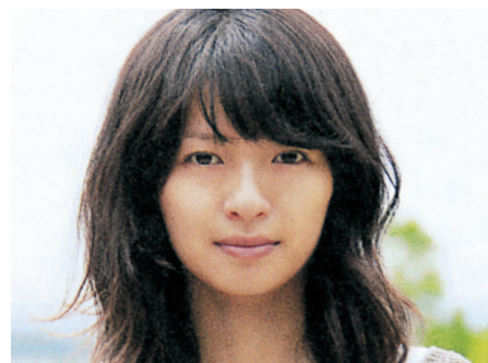
堂蘭つぐみ [榮倉奈々] 仕事を辞め、東京から田舎の祖母の家へ