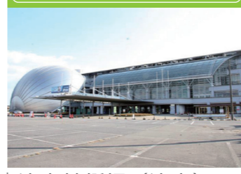
津市競艇場 (津市) 海江田がレースの後鑓を落とすシーン