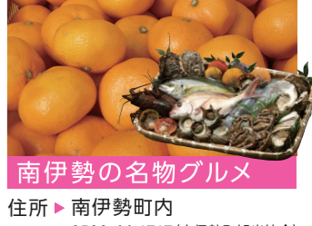
南伊勢の名物グルメ 住所 ▶ 南伊勢町内 TEL ▶ 0599-66-1717(南伊勢町観光協会) 熊野灘に面し、県下一の水揚げを誇る南伊勢で新鮮な魚介類はもちろん、山の恵みもとことん味わおう!