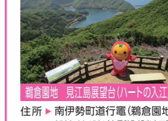
鷺倉園地 見江島展望台(ハートの入江) 住所 ▶ 南伊勢町道行電(鷺倉園地) TEL ▶ 0599-66-1501(南伊勢町観光商工課) 鷺倉園地(見江島展望台)からハートの形をした入江が見えるよ。ここで思いを告白すれば、きっと届くかも。