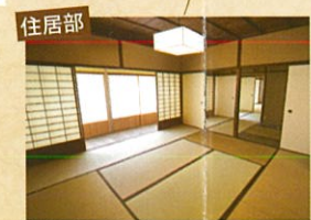
住居部は仕上げの品質が茶室部より下がります。