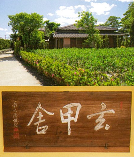
玄甲舎の板額（正面玄閣の奥に掛る）

築一七〇年の歴史を感じる空間に浸る 玄甲舎の由来であり特徴である“亀” 得水は亀をこよなく愛しており、得水ゆかりの品々には、自筆のサインとともに朱書きした亀の図形も用いられています。