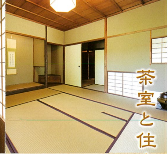
玄甲舎の座敷（八畳）床の間