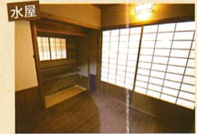
表千家流の構えの水屋