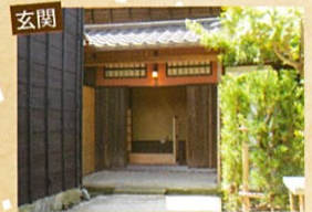
迎賓用の玄閣は武家の凧とした趣きがあります。