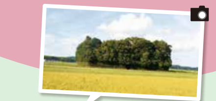
朽羅神社(摂社) 石佛庵